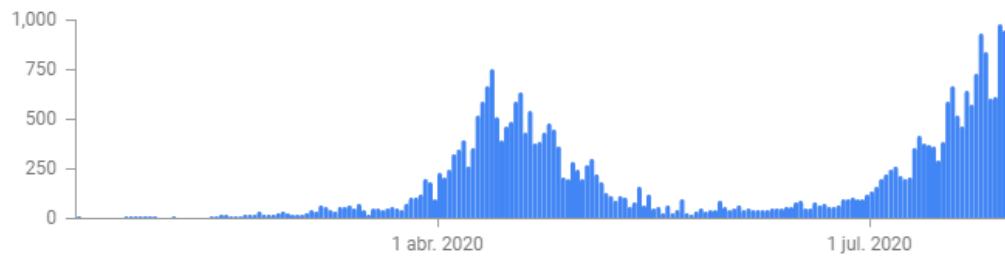
Figura 3: Coronavirus (Covid-19) en Japón.